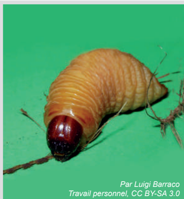
Par Luigi Barraco Travail personnel, CC BY-SA 3.0