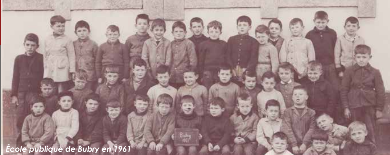
École publique de Bubry en 1961

Le redoublement était redouté car on perdait alors les copains et copines de la «division».