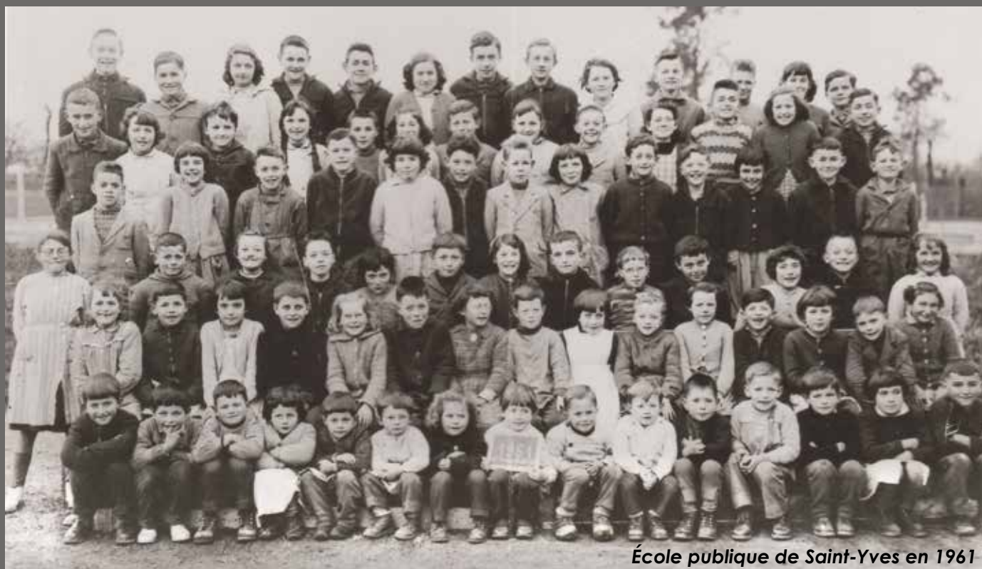
École publique de Saint-Yves en 1961

A chaque fin de trimestre, une grande épreuve attendait les enfants : les «compositions» ! L'addition des résultats en français, mathématiques, histoire, etc., donnait lieu à un classement. Les têtes de classe se disputaient les trois premières places à coups de centièmes de points. Les autres, dans le «ventre mou» de la classe, attendaient la fin de l'année pour savoir s'ils étaient admis dans la division supérieure avec, à la clé, un nouveau maître... parfois craint.