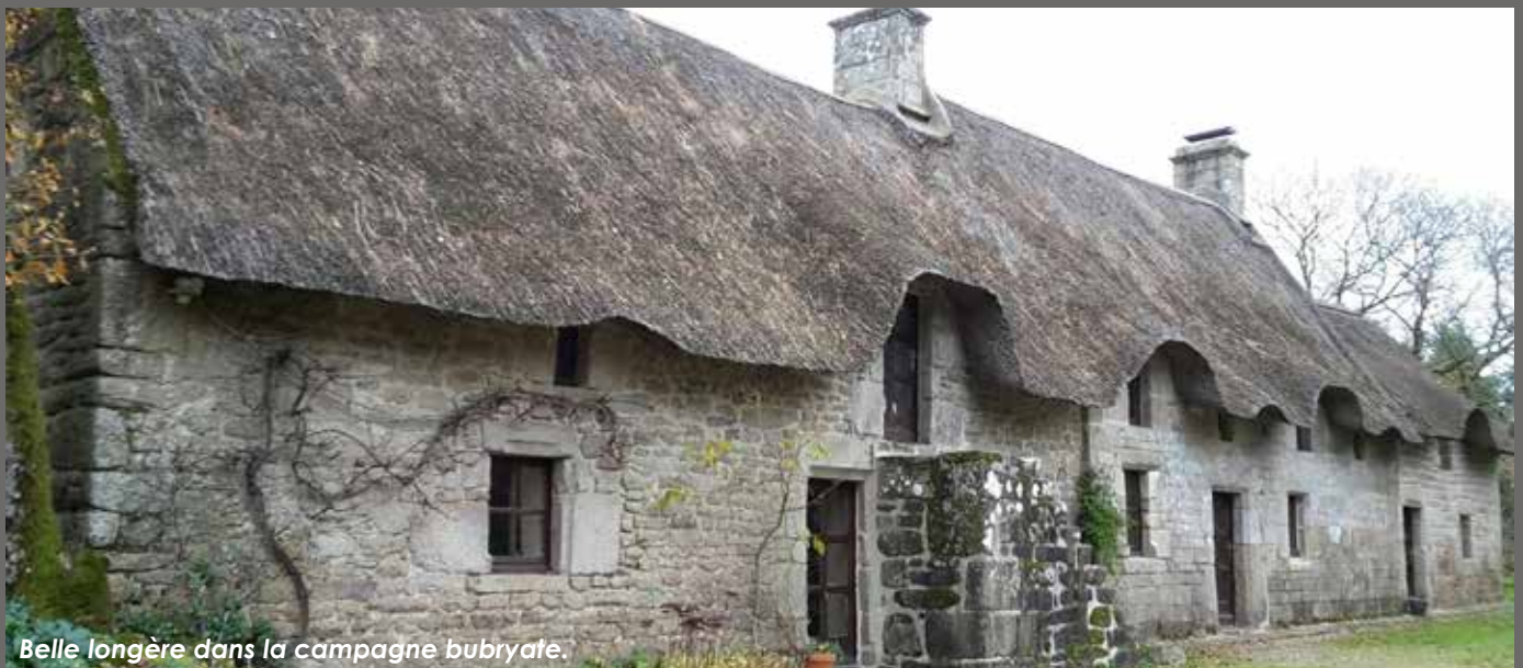
Belle longère dans la campagne bubryate.