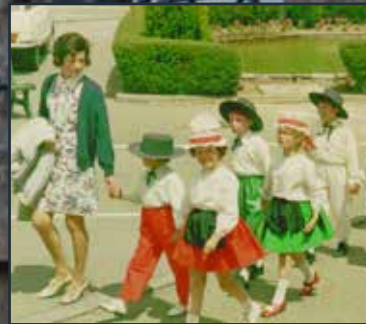
Retour sur notre école