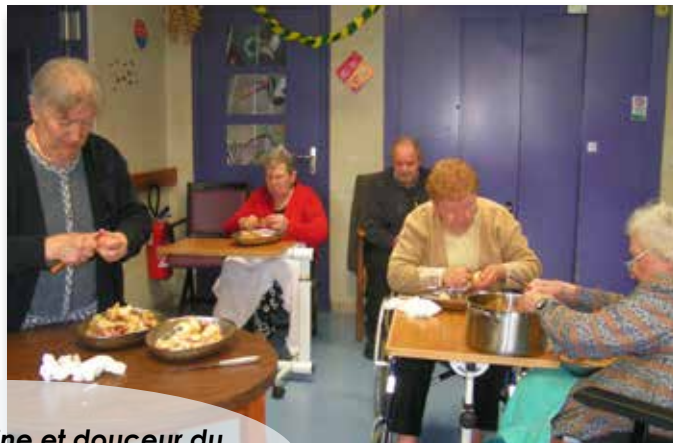
Jeux, danses, cuisine et douceur du farniente au soleil sont appréciés par les résidents.