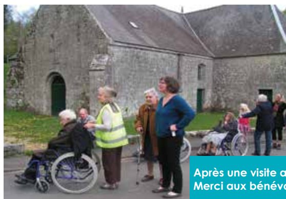
Après une visite au Pôle enfance jeunesse, balade à la chapelle Sainte-Hélène. Merci aux bénévoles qui ont rendu possible cette sortie !