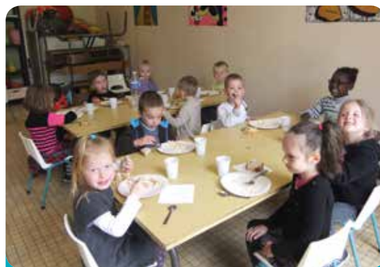
On déguste le traditionnel « Bol de riz »

Notre thème de travail pour l'année 2014-2015 : le cinéma.