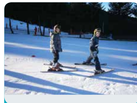
Vive la glisse !