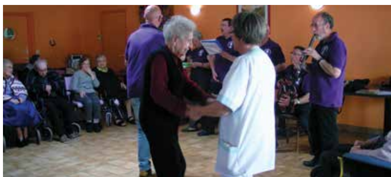
Musique et danses bretonnes en compagnie des musiciens et des chanteurs de l'association Speread Bro Ploue.