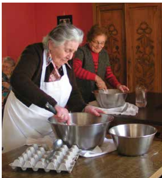
Atelier crêpes : le coup de main est là !