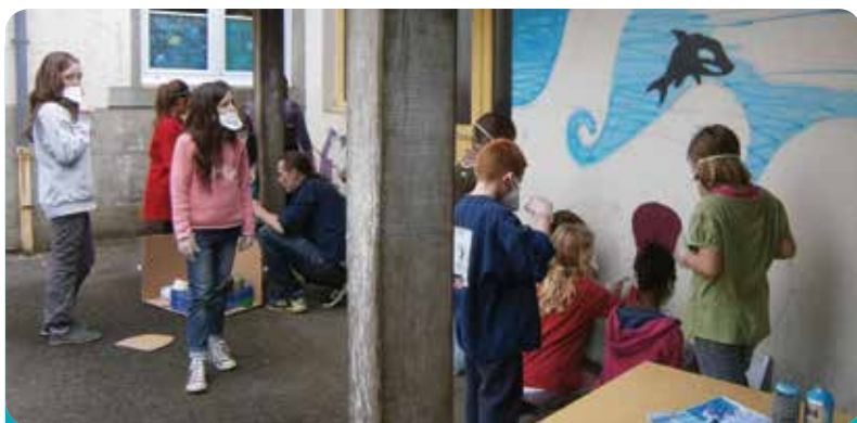
Les artistes à l'œuvre !