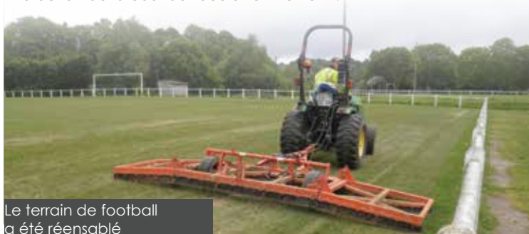
Le terrain de football a été réensablé