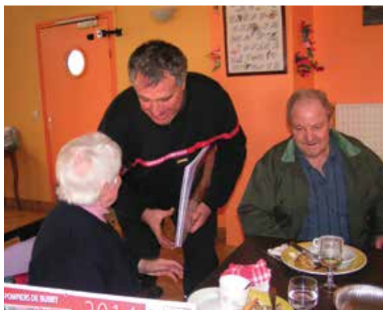
Chaque année, les pompiers de Bubry rendent visite aux résidants et leur offrent un calendrier.