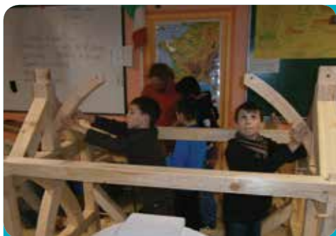
A la découverte des sciences !

Enfin, pour celles et ceux qui ne connaissent pas l'école, vous pouvez faire une visite virtuelle en passant par youtube : école privée bubry.