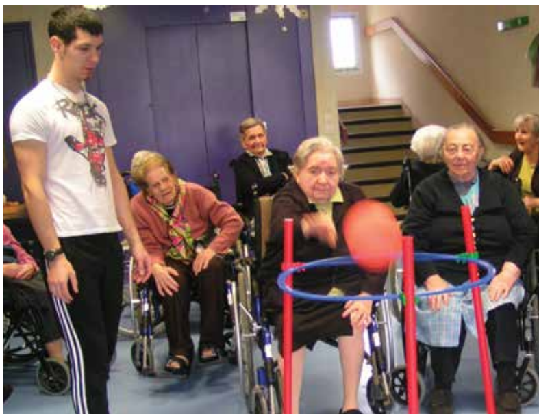
Chaque vendredi, atelier sportif avec un animateur de l'association Sport 56.