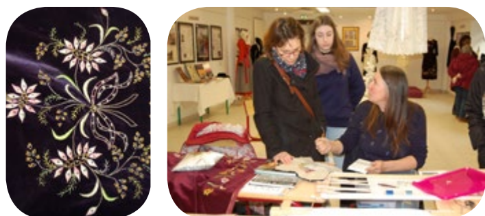
Les brodeuses de l'association « Fibres et couleurs » de Brandérion ont animé un atelier broderie et expliqué leurs techniques et les points employés.

Ensuite, à partir du 19 mai, les abonnés ont pu de nouveau