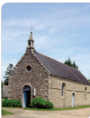
Chapelle N.-D. de la Salette

Prenez à droite par des chemins ombragés, jusqu'à la route des moulins.